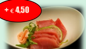
60. maguro sashimi (rauwe tonijn) +€ 4,50