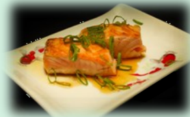
79. Sake yaki (gebakken zalm)