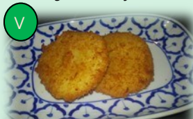
97. patato chizuboru (aardappel koekjes)