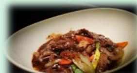
100. beef in zwarte pepersaus