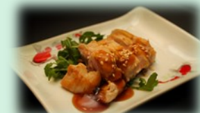
72. tori teriyaki (kipfilet met teriyakisaus)