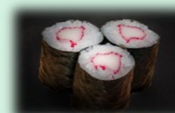
45. kani maki (krab)