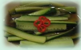
90. Kyuri Zuke (zoetzure komkommer)