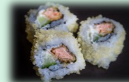
30. Sake cheese roll (zalm/roomkaas)