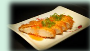
71. tori furai (gefrituurde kip)