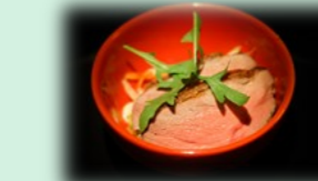
56. aikamo sarada (eendenborst salade)