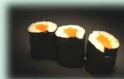
41. sake maki (zalm)