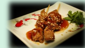
74. ramuyaki kushi (lamsspies)