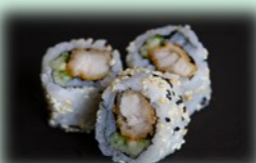
31. Tori roll (gefrituurde kip)