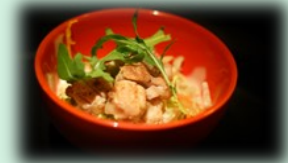
55. tori sarada (kip salade)