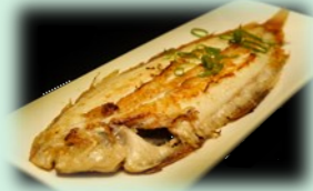
80. sakana yaki (sliptong)