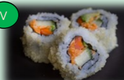
35. Spicy carrot roll (pittige wortel)