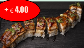
61. dragon roll (gefrituurde garnaal met paling) +€ 4,00