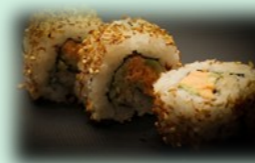
27. Spicy salmon roll (pittige zalm)