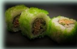
26. Spicy tuna roll (pittige tonijn)