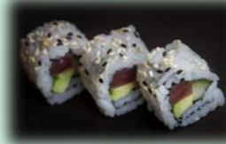
29. Tekka roll (tonijn)