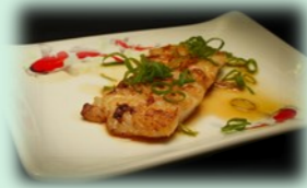
81. terapia yaki (tilapia filet)