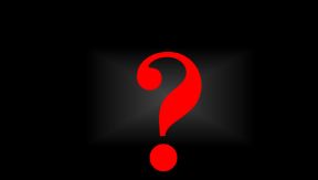
58. sushi v/d maand