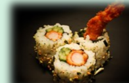
33. Ebi roll (gefrituurde garnaal)