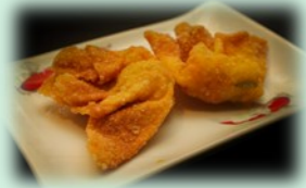
89. gefrituurde pangsit