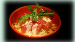
52. Tekka sarada (tonijn salade)