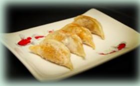
87. gyoza (gebakken dumpling)