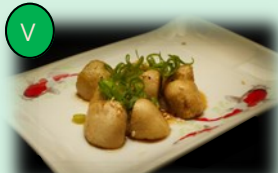
91. kinoko yaki (gebakken champignons)