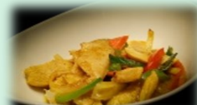
101. kip in kerriesaus