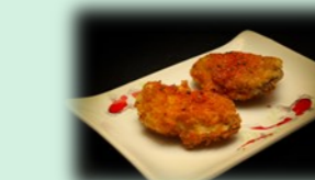
73. tebasaki (kipvleugels)