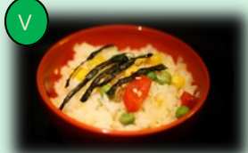
94. yaki meshi (gebakken rijst)