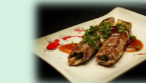
76. usuyaki (beefrolletjes)