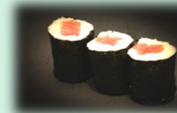
42. tekka maki (tonijn)