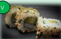
34. Veggy roll (vegetarische rol)