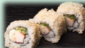
37. Hawaï roll