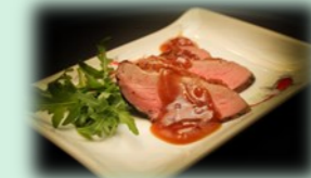
77. aikamo (eendenborst filet)