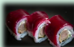
32. beef roll (ossenhaas/roomkaas)