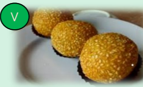
99. sesam balletjes