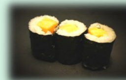
43. Tamago maki (zoete omelet)