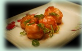
85. chili ebi (gebakken garnalen)