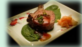
78. ramuchoppu (lamsrack)