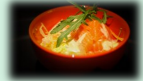
51. sake sarada (Zalm salade)