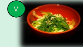
50. wakame sarada (zeewier salade)