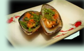
83. kaki yaki (gebakken mossel)