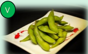
93. edamame (Japanse boontjes)