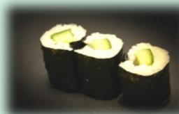
40. Kapa maki (komommer)