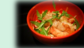
53. ebi sarada (garnalen salade)