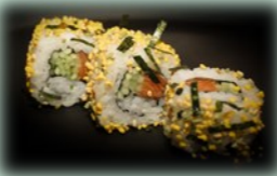
28. Sake roll (zalm)