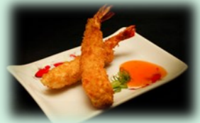
86. ebi furai (gefrituurde garnalen)