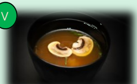
98. misoshiru (sojabonen soep)