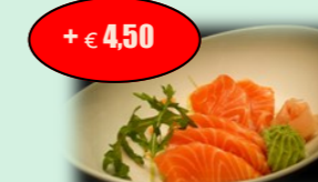
59. sake sashimi (rauwe zalm) +€ 4,50