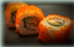
25. california roll