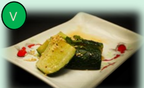
92. zucchini yaki (gebakken courgette)