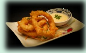
84. ika tempura (inktvisringen)