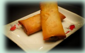
88. mini loempia