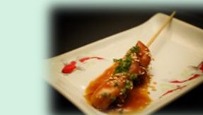
70. yakitori kushi (kipspies)