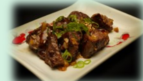
75. gyu yaki (beefblokjes)