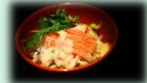
54. kani sarada (krab salade)