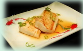
82. minou yaki (panga filet)