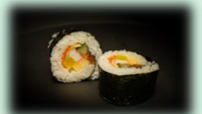
38. futo maki (grote rol)