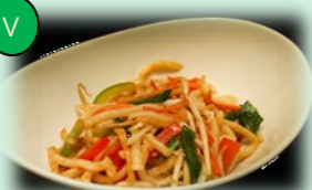
95. yaki udon (gebakken udon mie)