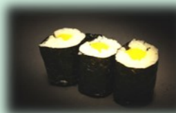
44. oshinko maki (japanse radijs)